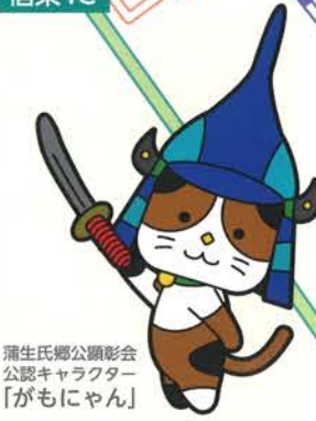
蒲生氏郷公顕彰会 公認キャラクター 「がもにゃん」